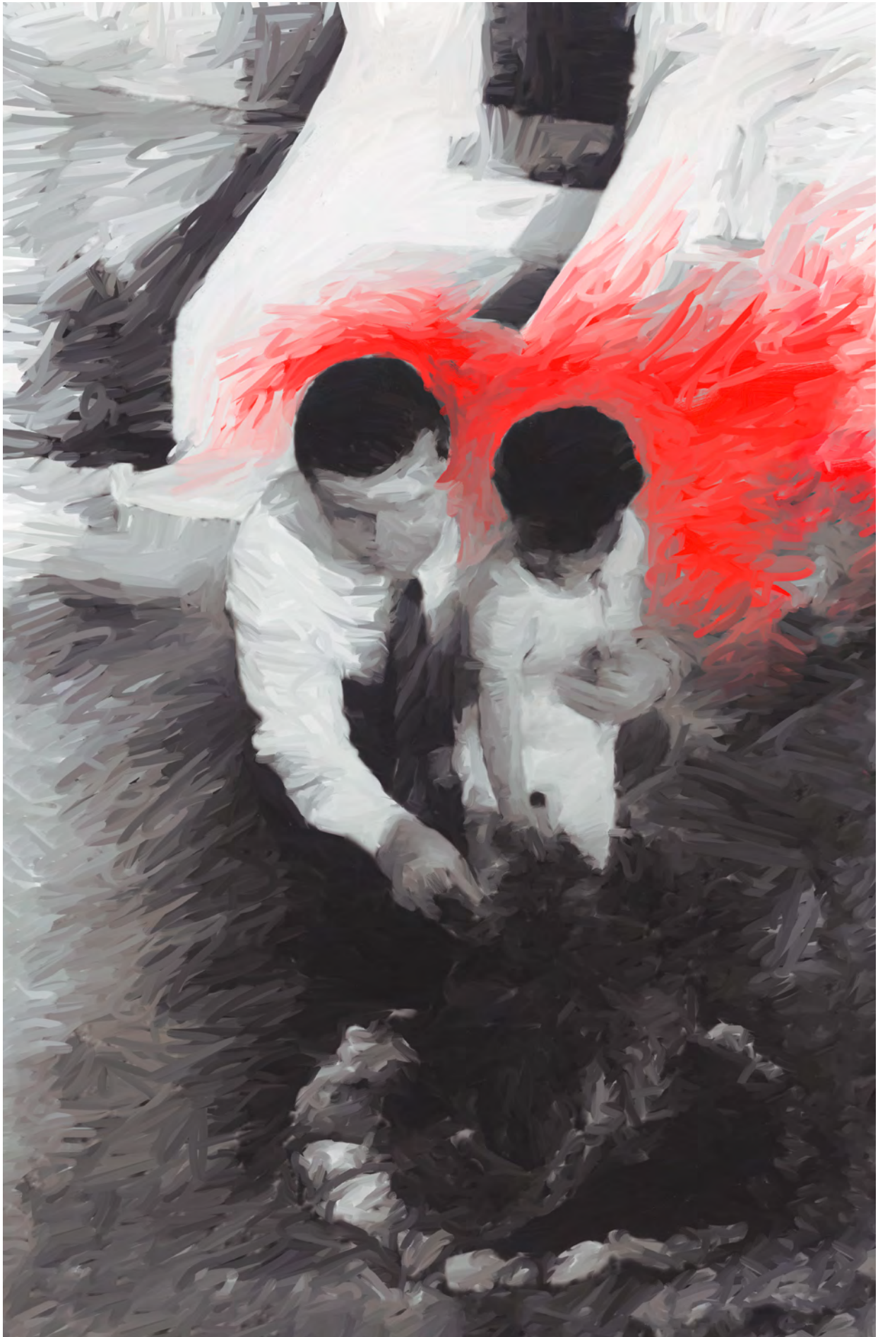
MWF 12 | 2019 | Edition 3, Pigmentdruck auf Papier, 80 x 110 cm