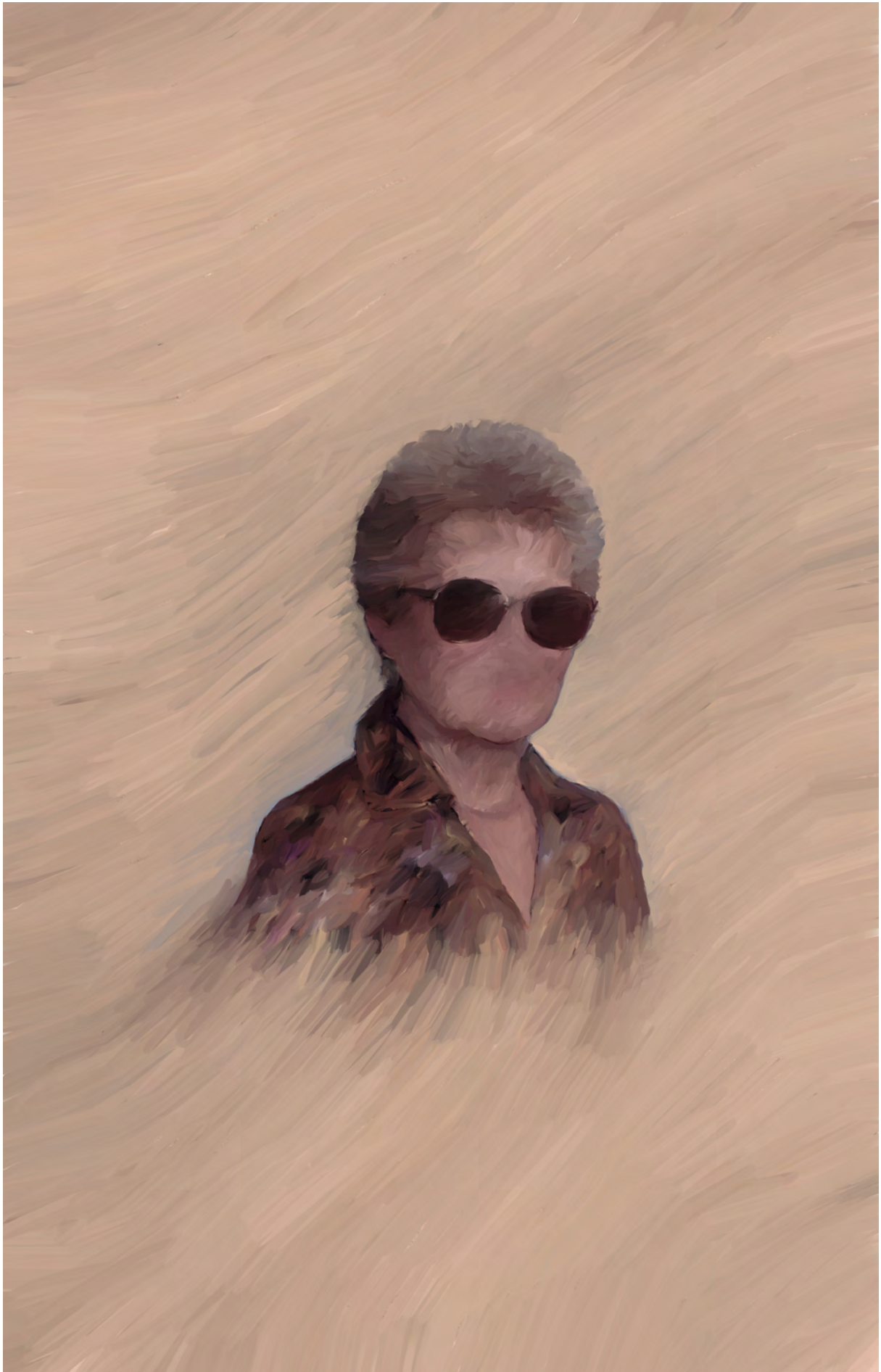
MWF 33 | 2019 | Edition 3, Pigmentdruck auf Papier, 80 x 110 cm